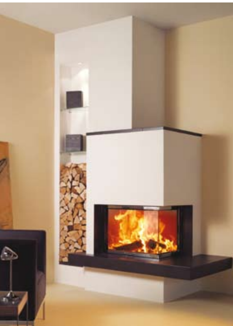
Vakolt építmény kerámia vagy kőburkolattal; tűztér típusa: Varia 2Rh A