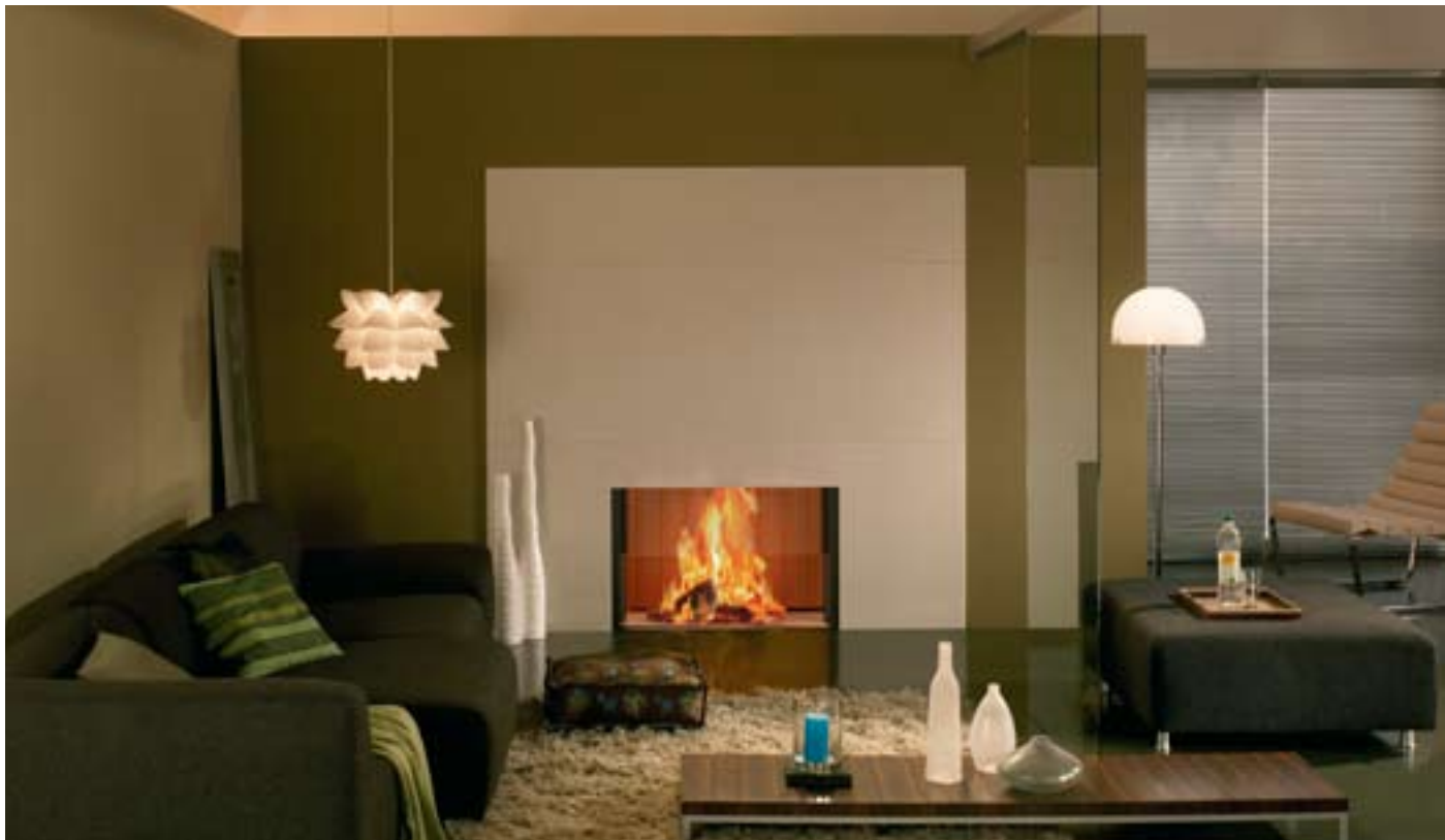
Tűztér típusa: Linear Arte Xh 3S

Németország piacvezető kandalló-gyártó cége, ahol a német minőség és műszaki tartalom a designnal párosul. Tűztereik kialakításában különösen nagy a hangsúlyt kap a tűz látványa, ezért a készülékeiket nagy és működés közben is tiszta üvegfelületek jellemzik. Akár egytlen darabot is készek legyártani a megrendelő igényének megfelelően, egyedi méretben. Valamennyi tűzterükhöz csatlakoztatható külső környezeti égési levegő, így a készülék nem a lakótérből használja az égési levegőt. További – minden típushoz rendelhető – kiegészítő a hátulról nyitható tüzelőajtó, amely segítségével a tüzelőanyagot akár egy másik helyiségből is rárakhatjuk és nem kell a nappaliban tárolnunk a tüzelőt.