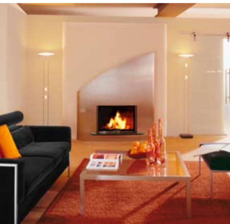
Tűztér típusa: Varia Eh