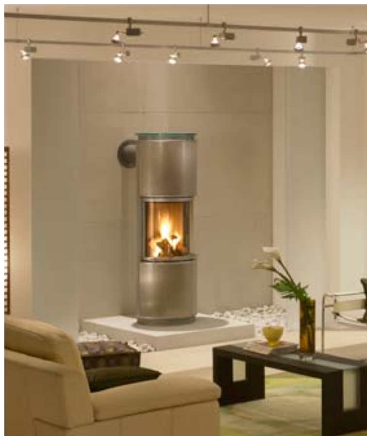
Exkluzív kandallókályhák nem igényelnek nagy helyet a lakásban és kellemes meleget varázsolnak szobánkba. Kandallókályha típusa: Piu