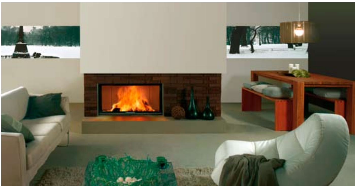
Tűztér típusa: Linear Varia Bh 4S