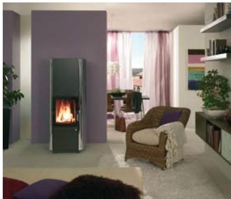
A három oldalon, 90°-os szögben hajlított üvegfelülettel rendelkező kandallóbetétben égő tűz látványát a szoba bármely pontjáról élvezhetjük. Tűztér típusa: Varia C S.