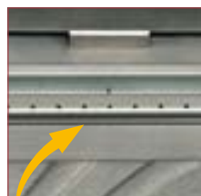
UTÓÉGETŐ (TERCIER) LEVEGŐ BEÁRAMLÁSA