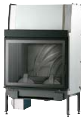
UNIVERS 200 A D PACK PN