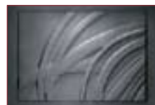
A TŰZTÉR HÁTLAPJA

„INAIR” külső égési levegő rendszernek köszönhetően a készülék alkalmas külső környezeti égési-levegő fogadására, így kandallónk a lakás légtérétől teljesen függetlenül üzemel. Nem jelent többé problémát a kandalló működése szempontjából a tökéletesen zárt nyílászáró, egy nagy teljesítményű szagelszívó vagy központi porszívó.