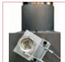
DUPLA BOVDENNEL SZABÁLYOZHATÓ PILLANGÓSZELEP