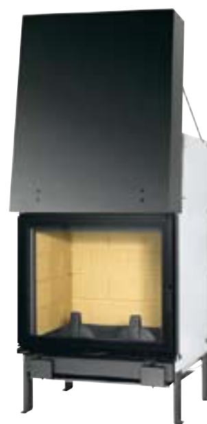
UNIVERS 231 A PN